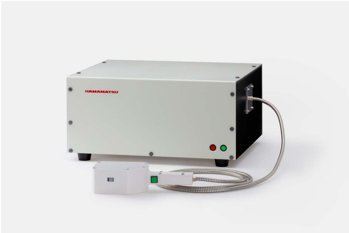
ハンディプローブ テラヘルツ波分光分析装置 C16356