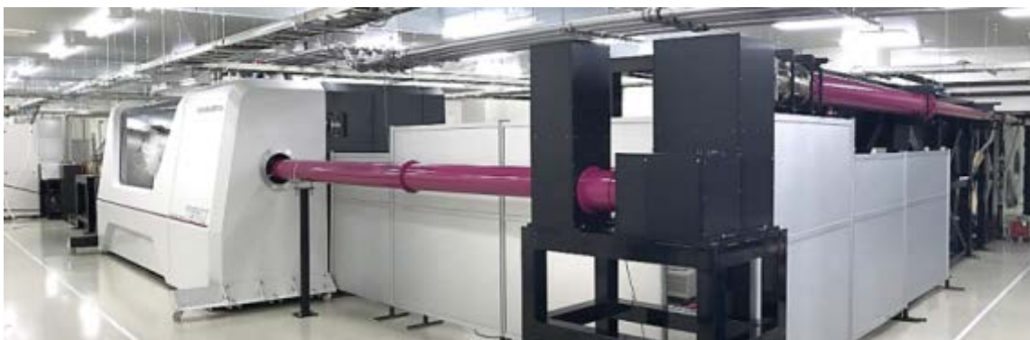
100J級のレーザ（写真左）とビーム配管（紫色の配管）