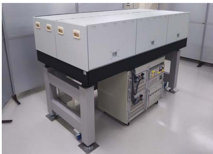
パワーレーザー装置外観

報道関係者には、写真をデータで提供しますので、 下記 浜松ホトニクス株式会社 広報室までお申し付けください。