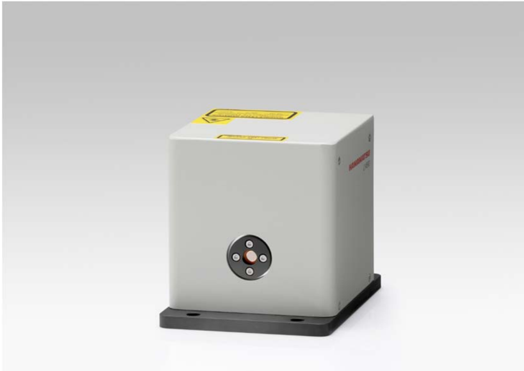
波長掃引パルス量子カスケードレーザ L14890-09