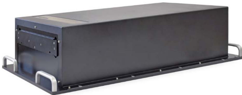
X線 TDI カメラ C15400-30-50A