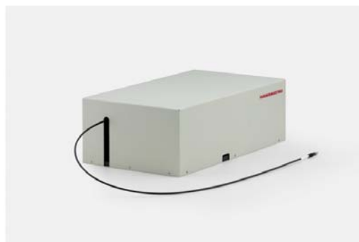
新開発のQCL（左）とファイバアウトユニット（右）の外観